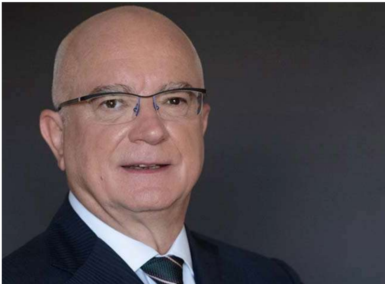
Γράφει ο ΧΡΗΣΤΟΣ ΜΕΓΑΣ

Στη συνέχεια (2019) αποτέλεσε την μοναδική εναλλακτική στον Τσίπρα και πρόσφατα (εκλογές Μαΐου-Ιουνίου 2023), προέβαλ-