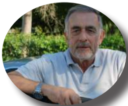
Άρθρο του Αντώνη Κολιάτσου

Σημείωση-2 Η λύση του προβλήματος θα δοθεί με σχετική ανάρτηση στο «FB», στις 10/1/2024.