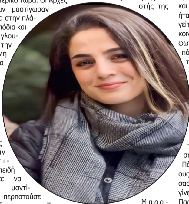
Μπ ρ α -