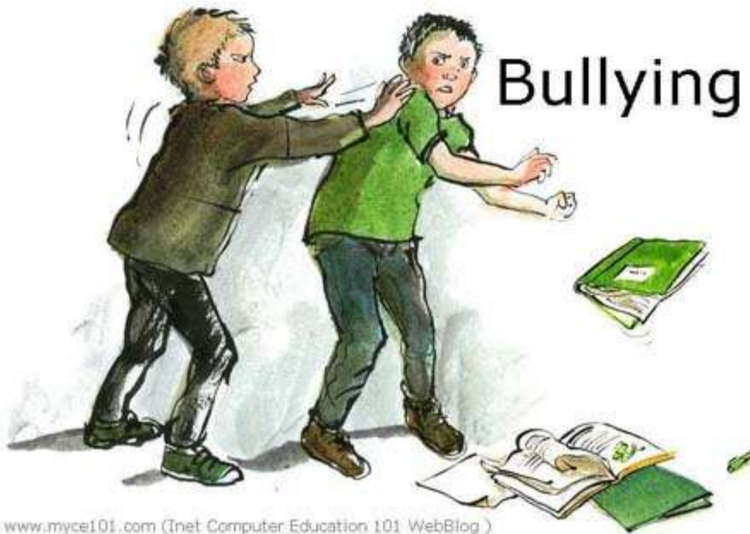
www.myce101.com (Inet Computer Education 101 WebBlog )

-Συγγνώμη αλλά η διεύθυνση του σχολείου δεν έχει ποινικές ευθύνες; Μόνο με ΕΔΕ βλέπω ότι λύνονται τέτοιου είδους ζητήματα. Μήπως πρέπει να ξεκινήσει και ο ποινικός έλεγχος μπας και αρχίσουν να κάνουν την δουλειά τους ; -Εσύ φίλε θες να ξεκινήσουν