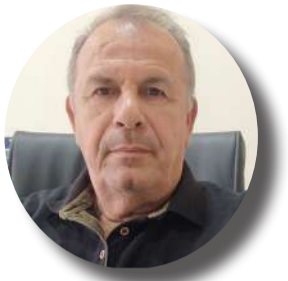
Άρθρο του ΒΑΣΙΛΗ ΜΑΓΚΟΥΤΗ