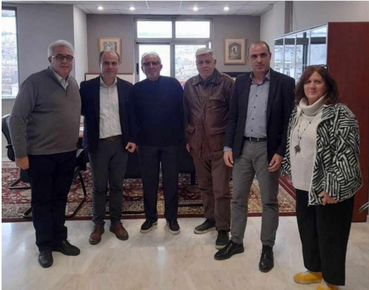
το Αθλητικό Σωματείο «ΑΣ ΠΥΡΡΟΣ», τον Δήμο Αρταίων και την Περιφέρεια Ηπείρου.

Το Αθλητικό γεγονός, θα τελεί υπό την αιγίδα της Ελληνικής Ομοσπονδίας Αισθητικής Ομαδικής Γυμναστικής, σε συνδιοργάνωση με