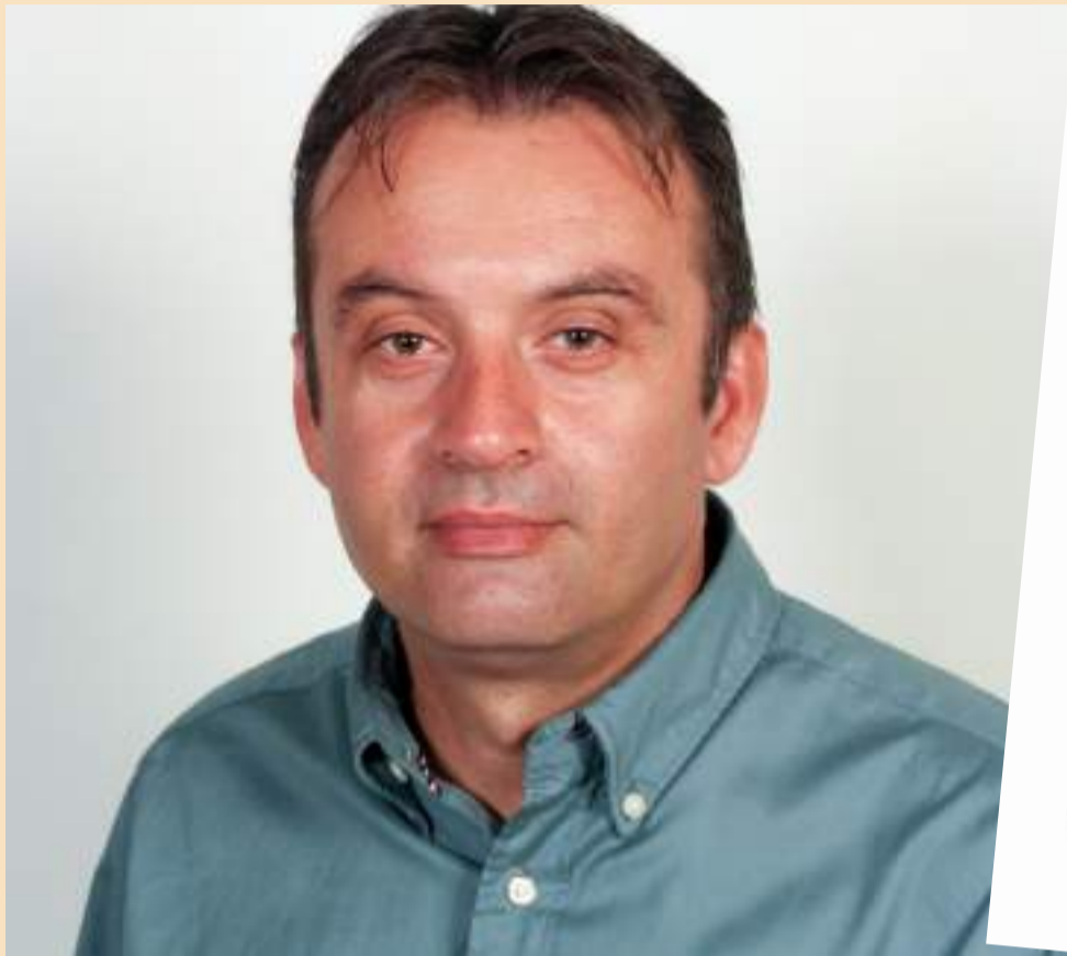
Υπηρεσία Συντονισμού, Γραμμάτεια Υποδομών, Γενική Διεύθυνση Συγκοινωνιακών Υποδομών, Γενική Διεύθυνση Συγκοινωνιακών Υποδομών, Γενική Διεύθυνση Συγκοινωνιακών Υποδομών, Γενική Διεύθυνση Συγκοινωνιακών Υποδομών

Στις 02-4-2024, έπειτα από επικοινωνία με τον Βουλευτή Χαλκιδικής κ. Πάνα Απόστολο, μου κοινοποιήθηκαν απαντητικά έγγραφα από Διευθύνσεις του Υπουργείου Υποδομών και Μεταφορών αναφορικά με την τεθείσα ερώτηση, τα οποία και δίνουν λύση στο υφιστάμενο πρόβλημα και βρίσκονται στη διάθεση των πολιτών και αρμόδιων φορέων του ν. Άρτας και της Περιφέρειας Ηπείρου. Αυτά αφορούν σε: