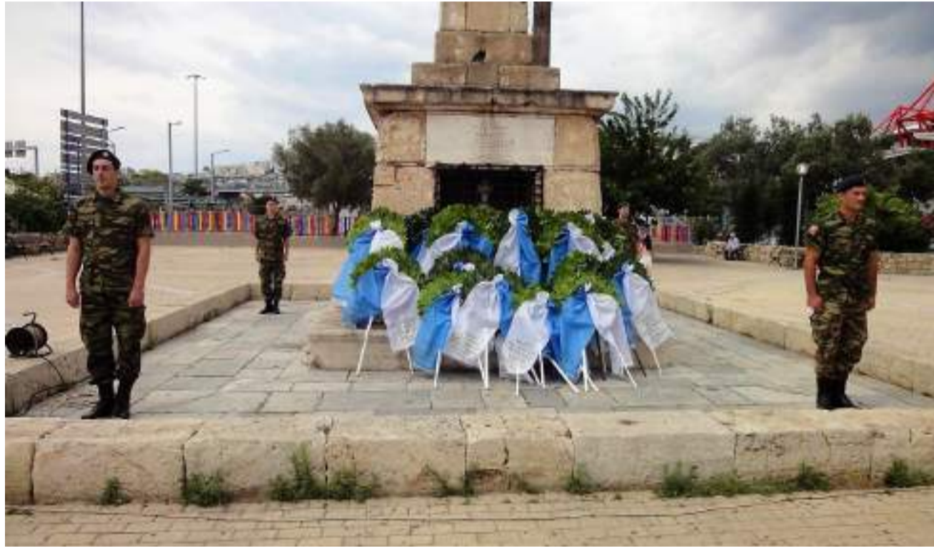
“Οι συνημμένες φωτο απεικονίζουν στιγμιότυπα από την ειδική πάνδημη τελετή, ανήμερα της εορτής του Αγίου Γεωργίου (23/04/2019), για τον «επαναπατρισμό» των οστών του Γεωργίου Καραϊσκάκη, από το κενοτάφιο ηρώων του Φαλήρου, στη «γενέτειρά» του, το Μαυρομάτι ν. Καρδίτσας.”

βερά ντοκουμέντα», που κατά τον πλέον επίσημο και κατηγορηματικό τρόπο επιβεβαιώνουν την εξ' αίματος και τόπο «Σκουληκαρήτικη» καταγωγή του μεγάλου Καραϊσκάκη, ακόμη σήμερα βλέπει κανείς: Πολιτειακούς, Πολιτικούς, Εκκλησιαστικούς, Δικαστικούς, Αυτό-διοικητικούς ιθύνοντες, επώνυμους ανθρώπους του πνεύματος, διακεκριμένους