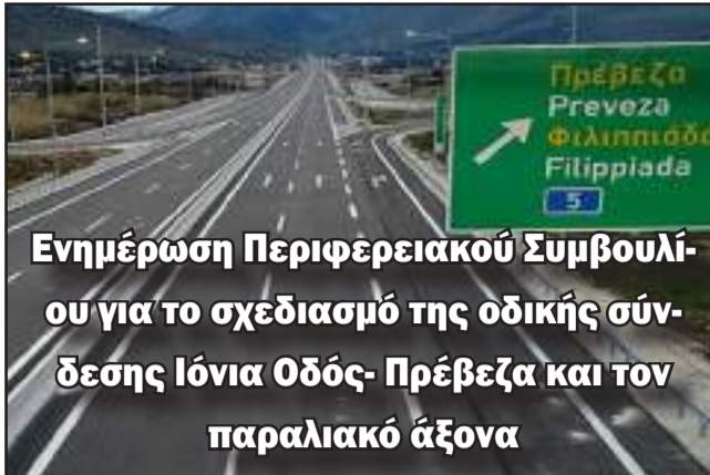
Ενημέρωση Περιφερειακού Συμβουλίου για το σχεδιασμό της οδικής σύνδεσης Ιόνια Οδός- Πρέβεζα και τον παραλιακό άξονα

Ήταν Τρίτη και 13 του 2021, οπότε και η εφημερίδα ΑΠΟΨΗ, ένα παιδί της εποχής που ακολούθησε την κρίση του κορωνοϊού, κυκλοφόρησε στην περιοχή της Άρτας. Κάνοντας έναν απολογισμό του τότε με το σήμερα, θα λέγαμε ότι παρά τον παροξυσμό των κοινωνικών μέσων δικτύωσης, και την μετατόπιση της ενημέρωσης στις σελίδες του διαδικτύου, ο έντυπος Τύπος έχει αποκτήσει μια υπεραξία... Οι λόγοι, δεν χρειάζεται να αναλυθούν επί του παρόντος, αλλά σε μεγάλο βαθμό ερείδονται στα ποιοτικά χαρακτηριστικά, τα οποία απαιτούνται για την έκδοση και κυκλοφορία σήμερα, ενός πιστοποιημένου εντύπου, με τις διαδικασίες για την απα-