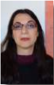
Της ΚΩΝΣΤΑΝΤΙΝΑΣ ΖΗΔΡΟΥ ΑΡΧΑΙΟΛΟΓΟΥ

Μετά την κατάληψη της Κωνσταντινούπολης από τους Σταυροφόρους της Δ΄ Σταυροφορίας και την πρόσκαιρη κατάλυση της Βυζαντινής Αυτοκρατορίας, οι επαρχίες της διαμοιράστηκαν, ύστερα από κοινή απόφαση, στους Λατίνους ευγενείς. Η Πελοπόννησος αποφασίστηκε να δοθεί στους Φράγκους. Οι κατακτητές αντιμετώπισαν σθεναρή αντίσταση στη Μ. Ασία από τους απογόνους των μεγάλων βυζαντινών οικογενειών, οι οποίοι δημιούργησαν τα ανεξάρτητα ελληνικά κράτη, την Αυτοκρατορία της Νίκαιας και την Αυτοκρατορία της Τραπεζούντας. Έτσι, οι Λατίνοι εγκατέλειψαν την προσπάθεια διεκδίκησης της συγκεκριμένης περιοχής. Αντίθετα, κατέλαβαν εύκολα τη βαλκανική χερσόνησο και τα ελλαδικά εδάφη, Θράκη, Μακεδονία, Στερεά Ελλάδα, εκτός από την Ήπειρο και τμήμα της Δ. Στερεάς, όπου είχε ιδρυθεί το Ανεξάρτητο Κράτος της Ηπείρου. Τη μεγαλύτερη αντίσταση στην κυρίως Ελλάδα προέβλεψαν οι ανεξάρτητοι τοπικοί άρχοντες Λέων Σγουρός, Μιχαήλ Χαμάρετος και ο Μιχαήλ Α΄ Κομνηνός Δούκας, καθώς είχαν και δυνάμεις και συμφέροντα για να αντισταθούν. Ωστόσο, μόνο ο τελευταίος κατόρθωσε να διατηρήσει την επικράτεια του ελεύθερη.