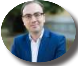
Γράφει ο ΒΑΣΙΛΗΣ ΤΣΙΡΚΑΣ

Η Ελλάδα είναι η δεύτερη φτωχότερη χώρα της Ευρωπαϊκής Ένωσης και οι Έλληνες πολίτες βιώνουν μια σκληρή οικονομική πραγματικότητα, αφού οι πραγματικοί μισθοί και τα εισοδήματα είναι χαμηλότερα από εκεί που βρίσκονταν πριν από 15 χρόνια.