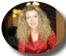
Γράφει η ΧΡΙΣΤΙΝΑ ΜΠΙΖΑ

Κ ατάμεστο ήταν το αμφιθέατρο του Επιμελητηρίου Άρτας την Τετάρτη 17 Απριλίου στις 7 το απόγευμα όπου διεξήχθη με πρωτοβουλία του Δήμου Αρταίων και του Εμπορικού Συλλόγου Άρτας ανοιχτή συζήτηση - ενημέρωση για την εξέλιξη του OPEN MALL για το χρονοδιάγραμμα υλοποίησης του καθώς και για τις όποιες δυνατότητες υλοποίησης και αποπεράτωσής του.