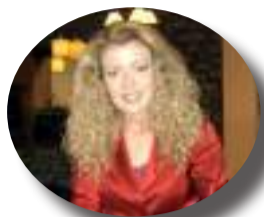
Γράφει η ΧΡΙΣΤΙΝΑ ΜΠΙΖΑ

Για την ημέρα Φιλελληνισμού και Διεθνούς Αλληλεγγύης πραγματοποιήθηκε σήμερα Παρασκευή 19 Απριλίου στο Πέτα έδρα του Δήμου Νικολάου Σκουφά εκδήλωση η οποία διοργανώθηκε σε συνεργασία του Δήμου Νικολάου Σκουφά με την Περιφέρεια Ηπείρου.