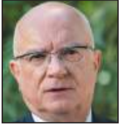
Γράφει ο ΧΡΗΣΤΟΣ ΜΕΓΑΣ

Σ την πόλη μας, που συνεχίζει να βιώνει τις επιπτώσεις της οικονομικής κρίσης και της ερήμωσης του Νομού Άρτας, γίνεται αυτές τις ημέρες το σύστριγγλο για την γκρίζα πέτρα, το ξερίζωμα των λίγων δέντρων (Μονοπλιό), τα... αντιαρματικά παγκάκια στην οδό Σκουφά.