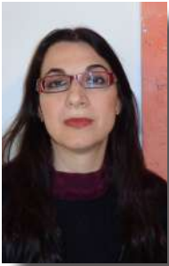
Της ΚΩΝΣΤΑΝΤΙΝΑΣ ΖΗΔΡΟΥ ΑΡΧΑΙΟΛΟΓΟΥ

Ο 13ος αιώνας αποτέλεσε ένα κομβικό σημείο στην ιστορική πορεία της Βυζαντινής Αυτοκρατορίας ή της Ανατολικής Ρωμαϊκής Αυτοκρατορίας, καθώς στις απαρχές του, το 1204, πραγματοποιήθηκε η κατάληψη της Κωνσταντινούπολης από τους Σταυροφόρους της Δ' Σταυροφορίας.