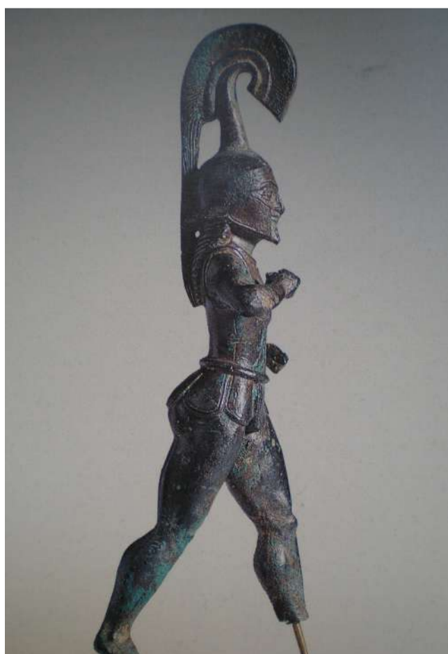
Εικ. 2 Χάλκινο αγαλμάτιο πολεμιστή του 6ου π.Χ. αι.