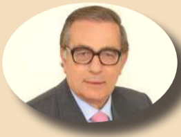
Γράφει ο ΑΝΤΩΝΗΣ ΚΟΛΙΑΤΣΟΣ