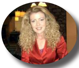
Γράφει η ΧΡΙΣΤΙΝΑ ΜΠΙΖΑ

Η Ένωση Απόστρων Αξιωματικών Στρατού Παράρτημα Άρτα κατόπιν αποφάσεως του ΔΣ/Ε.Α.Α.Σ συμμετείχε την 1η Σεπτεμβρίου ημέρα Κυριακή στον εορτασμό των προσκυνηματικών εκδηλώσεων για τους πεσόντες σε Γράμμο και Βίτσι διαθέτοντας ένα(1) λεοφορείο για την μεταφορά όσων επιθυμούσαν να παραστούν στις εκδηλώσεις με άφιξη στις 6 το πρωί από την Πλατεία του Ζέρβα και επιστροφή στις 7,30 περίπου στην Άρτα.