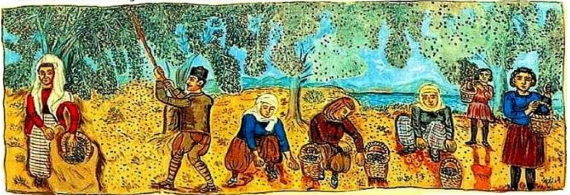
"Das Olivenöl Ernte" von griechische Volksmaler Theofilos

φρασης και δημιουργίας της λαϊκής σοφίας. Με τον όρο λαϊκή σοφία ή λαϊκές ρήσεις εννοούμε λέξεις, φράσεις, παροιμίες, γνωμικά, παραμύθια, παραδόσεις, αινίγματα, επωδές, ξόρκια, ευχές, κατάρες, ευτράπελες ιστορίες, την παραλογοτεχνία, το λαϊκό θέατρο και φυσικά μία από τις κορυφαίες εκφράσεις, το δημοτικό τραγούδι, τα οποία δημιούργησε ή χρησιμοποίησε ο λαός για να αποδώσει και να περιγράψει τις σκέψεις, τα συναισθήματα, τα όνειρα, τους φόβους, τις χαρές, τις λύπες, τη φιλία, τον έρωτα, τον πόνο, τον θάνατο, την αγάπη, το μίσος, τις προσδοκίες, τις απογοητεύσεις, τη μεγαλοσύνη ή τη μικρότητά του, την ειρωνεία, τη φιλαργυρία, την εκδικητικότητα, τη φιλοπατρία, την καθημερινότητα, το κοινωνικό και ιστορικό γίνεσθαι και γενικά ό,τι βρισκόταν στο μυαλό και στην καρδιά του αλλά για να στηλιτεύσει πρόσωπα και καταστάσεις, να διδάξει, να νουθετήσει, να επιχειρηματολογήσει, να διασκεδάσει, από νοσταλγία, για να φτιάξει μία ωραία ατμόσφαιρα ή για να αλλάξει την άσχημη διάθεση, για να δραματοποιήσει κ.α. Όλος αυτός ο θησαυρός ανιχνεύεται ήδη από την αρχαιότητα και τα έπη του Ομήρου, όχι ότι δεν προϋπήρχε, συνέχισε να εξελίσσεται, να εμπλουτίζεται και έφτασε έως τις μέρες μας. Σε μία ξεχωριστή ομάδα, εντάσσονται λέξεις και φράσεις οι οποίες χρησιμοποιήθηκαν διαχρονικά και εξακολουθούν να εμφανίζονται στον καθημερινό λόγο μας, έστω και εάν τις περισσότερες φορές δεν ξέρουμε την προέλευση, την ιστορία, τις συνθήκες δημιουργίας και την εξέλιξή τους.