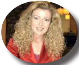
Γράφει η ΧΡΙΣΤΙΝΑ ΜΠΙΖΑ

Μ ε με πλούσιο περιεχόμενο δράσεων ήταν το 3ο Φεστιβάλ Αστυνομικής Λογοτεχνίας Άρτας το οποίο συνδιοργάνωσαν ο Μουσικοφιλολογικός Σύλλογος